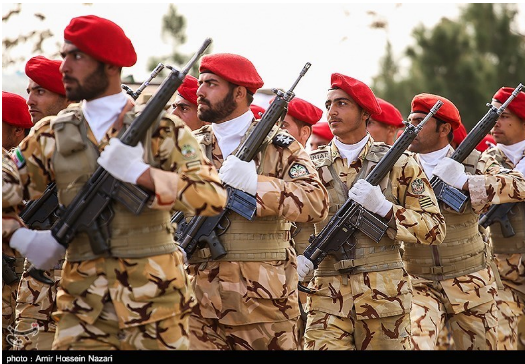
Défilé de l'armée iranienne (Artesh).

Les Pasdaran et l' Artesh abritent de nombreux think tanks s'intéressant à la doctrine militaire iranienne : le Center for Defensive National Security Studies et le Center for Strategic Defense Research , dirigé par Ahmad Vahidi, ministre de la Défense de 2005 à 2009 32 . C'est donc avant tout au travers des écrits d'individus proches du pouvoir politique que la doctrine militaire iranienne est façonnée, cristallisée et diffusée. Pour autant, la pensée doctrinale iranienne souffrirait d'une certaine stagnation intellectuelle, car les mêmes cadres militaires sont aux affaires depuis des décennies. À titre d'exemple, le chef d'état-major général des forces armées, Hassan Firouzabadi, à ce poste depuis 1989, a seulement été remplacé en 2016 par Mohammad Hussein Baqeri 33 .