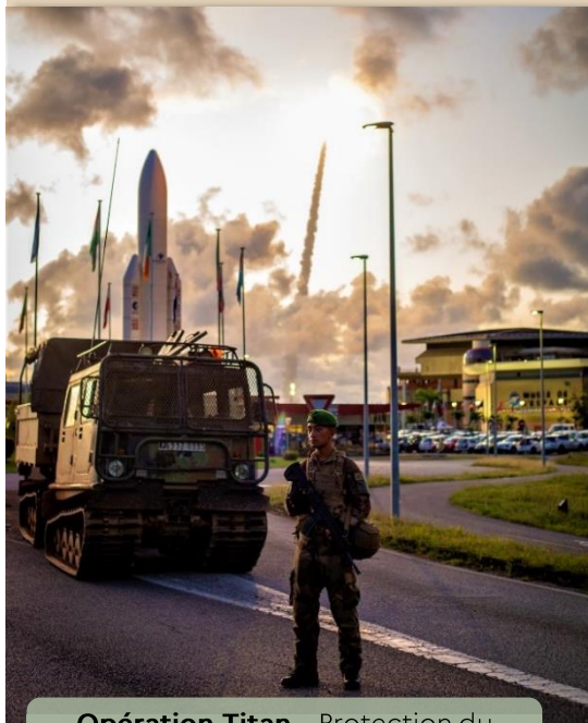
Opération Titan – Protection du centre spatial guyanais

Participation à la résilience de la Nation et à l'esprit de défense.