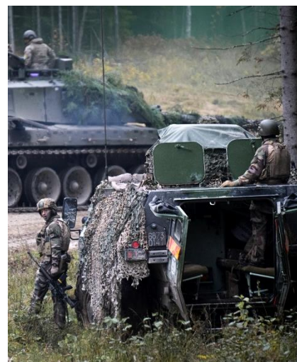
Exercice BOLD HUSSAR conduit en coopération avec l'Estonie, le Danemark et le Royaume-Uni dans le cadre de la Mission OTAN Lynx.