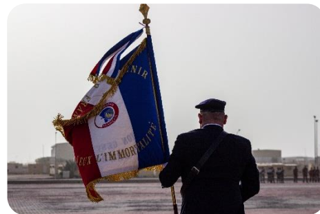
Ancien combattant en Outre-Mer

L'armée de Terre est l'armée des territoires. Solidement implantée en métropole, elle l'est tout autant outre-mer . A ce titre, son action investit différents champs : jeunesse, mémoire, réserve, recrutement. Ainsi, sur 14 431 jeunes recrutés en 2021, 1 555 (soit 10,8 % ) sont originaires d' Outre-mer , L'armée de Terre est également partie prenante de politiques publiques. Enfin, elle est connectée aux autorités civiles locales.