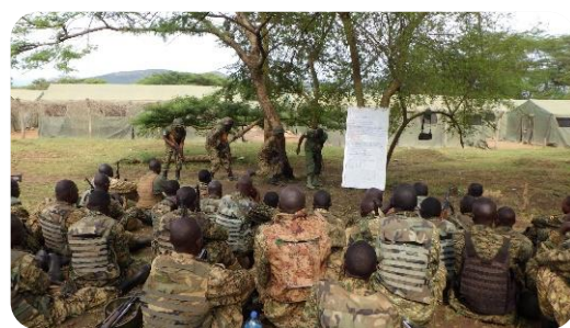
Afrique de l'Est