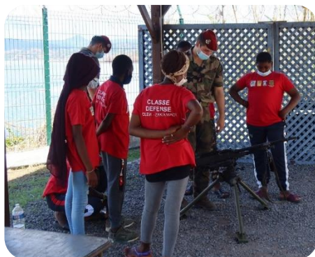
Classes sécurité défense globale à Mayotte