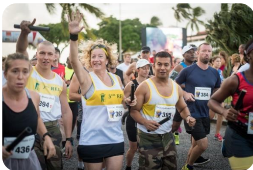
Participation des militaires et familles du 3 e régiment étranger d'infanterie au marathon de l'espace à Kourou (Guyane)