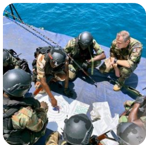
Afrique de l'Ouest

Le PMO désigne le domaine, très large, de la coopération avec des forces militaires de pays partenaires. Ancré dans la culture militaire française, le partenariat militaire opérationnel couvre un large spectre allant de la coopération structurelle à l'engagement conjoint en passant par la coopération opérationnelle. La création d'un Centre pour le Partenariat militaire opérationnel (CPMO) correspond à cette volonté de disposer pour l'armée de Terre d'une capacité structurée et cohérente. Le partenariat militaire opérationnel élargit l'empreinte de l'armée de Terre à l'étranger. Il contribue notamment aux engagements opérationnels par une meilleure connaissance de l'environnement, une plus grande légitimité de nos déploiements, une opportunité d'action en anticipation des crises et enfin la contribution à la montée en compétence et en efficacité des forces locales.